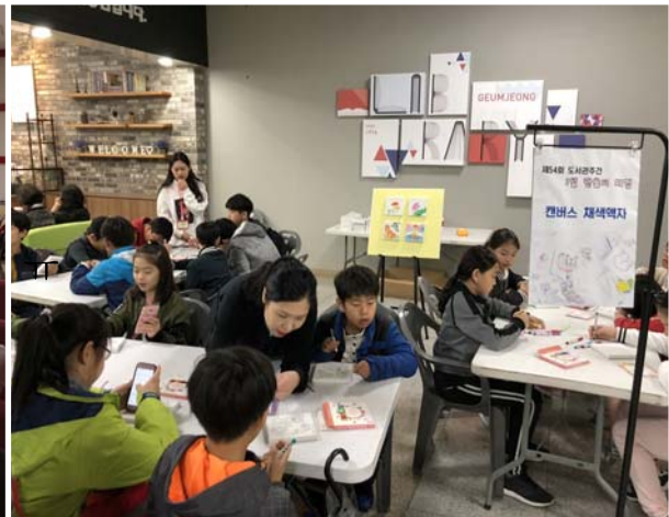
도서관 주간 행사 ‘캔버스 채색액자’