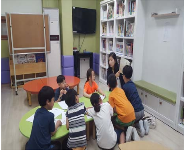
소외계층 독서 프로그램 지원