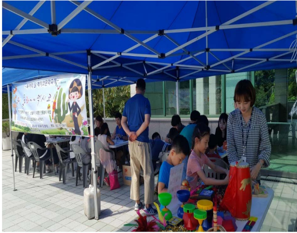
독서의 달 '멕시코 문화축제'