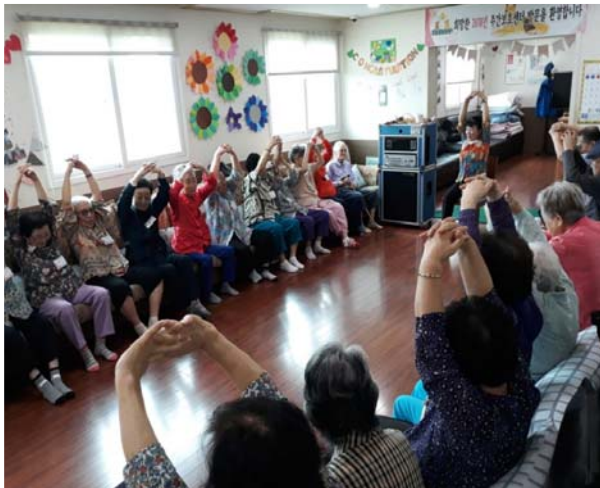
어르신 독서지원활동 사업 1