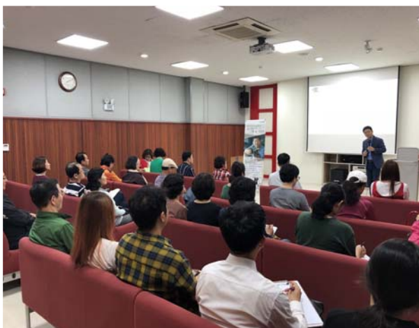
독서의달 저자강연 ‘책속 인문학’