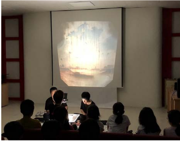
금多방 인문 예술 강연회 3