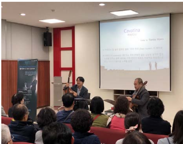
금도방 인문 예술 강연회 1