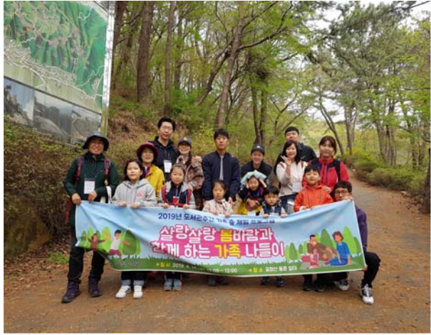
독서의 달 '숲체험'