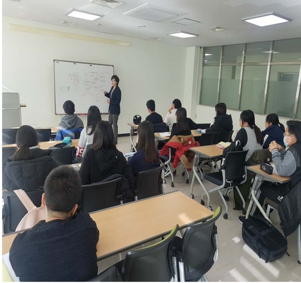
청소년 독서교실 1