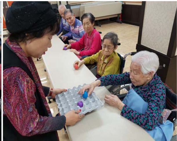
어르신 독서지원활동 사업 2