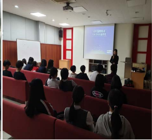
청소년 독서교실 2