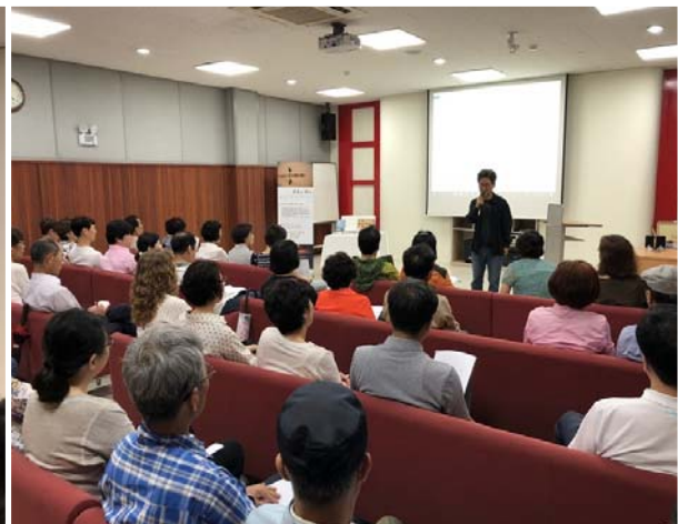
금도방 인문 예술 강연회 2