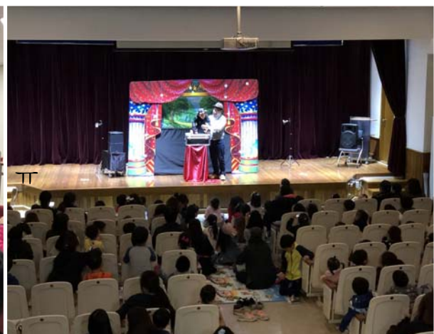
독서의 달 인형극 공연