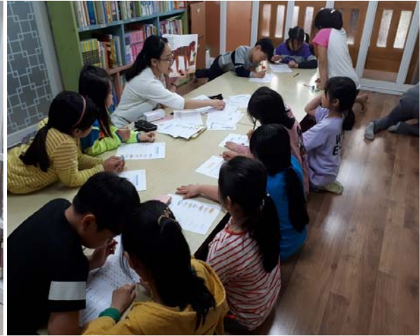
소외계층 영어강좌 지원