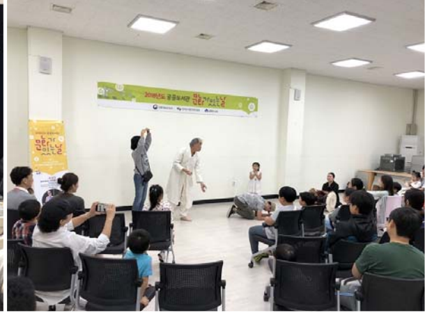
금도방 인문 예술 강연회