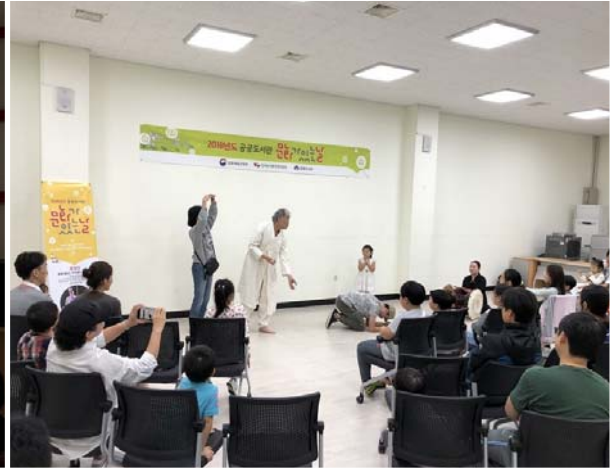
금多방 인문 예술 강연회 4