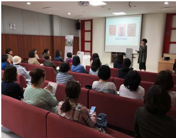
저자 북토크 ‘그림책에 마음을 묻다’