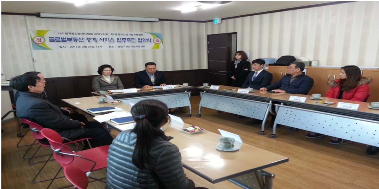
글로벌부동산 중개 서비스 업무추진 협약식