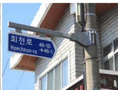
보행자용 도로명판 (설치 후)