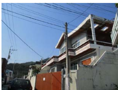
보행자용 도로명판 (설치 전)