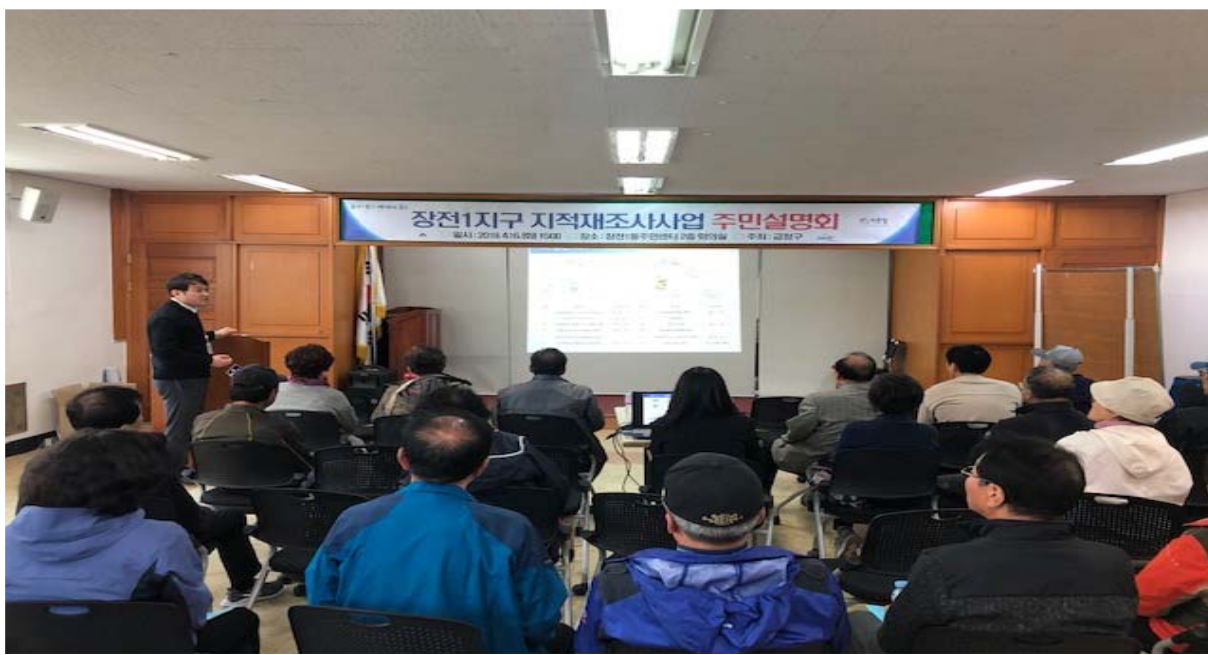
장전1지구 지적재조사사업 주민설명회 개최

장전1지구 사업개요 : 장전동 153-1번지 일원(142필지, 22천㎡)