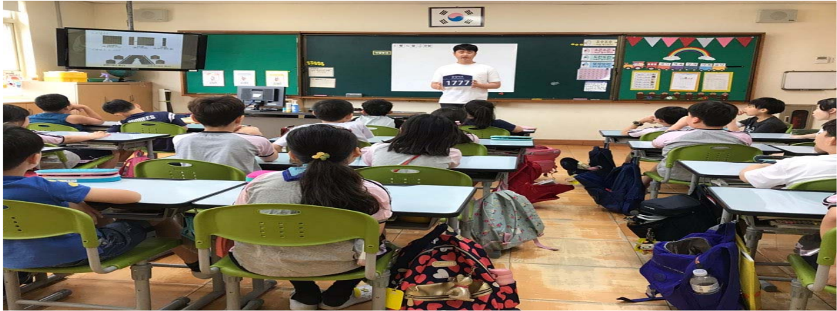
미래세대 도로명주소 홍보