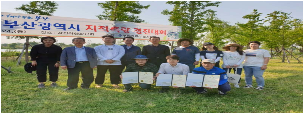
제1회 지적측량 경진대회 최우수 수상

도, 국공유지, 토지 - 건축물대장 상호간 자료 불일치 및 오류사항을 정정하여 공적장부 신뢰성 확보 및 대국민 행정서비스 품질 향상을 도모하고자 정비대상을 조사·검토 중에 있다.