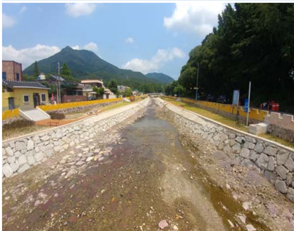
송정천 정비사업 1