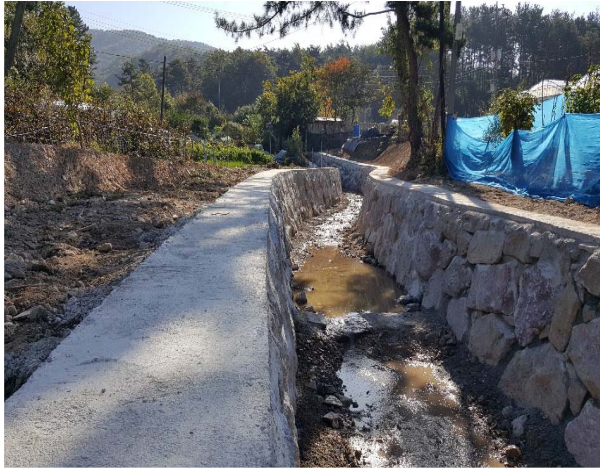
선동 신천마을 일원 구거정비공사 1