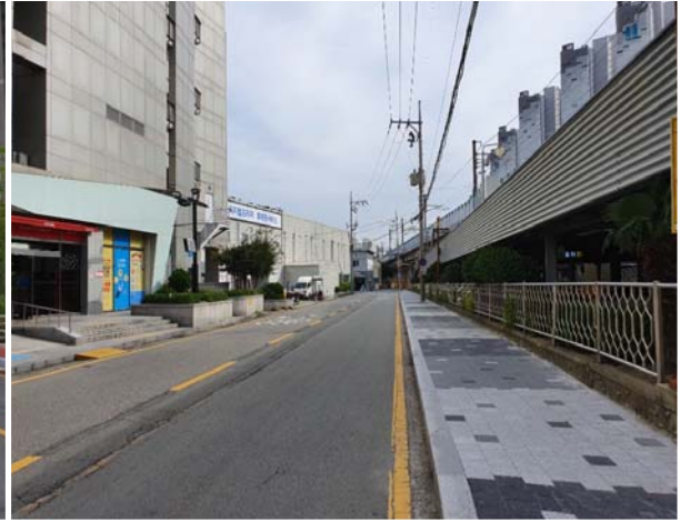
부산대역~장전역 간 보도정비공사 2