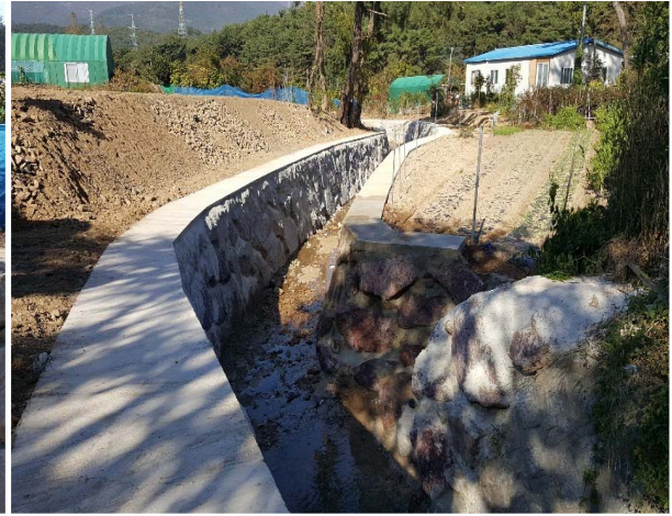
선동 신천마을 일원 구거정비공사 2