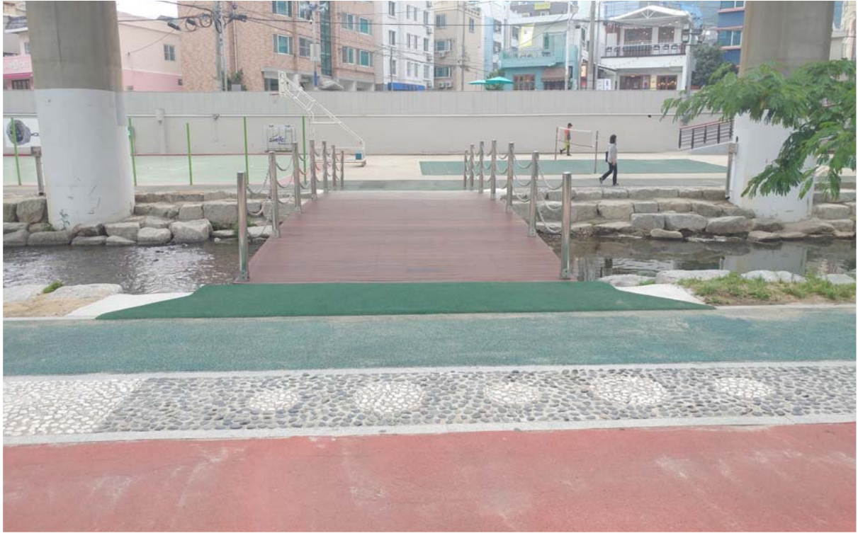
은천천 횡단보행로 설치사업