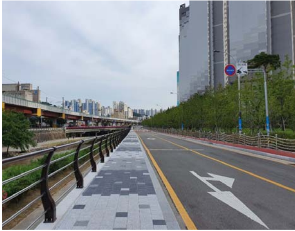
부산대역~장전역 간 보도정비공사 1