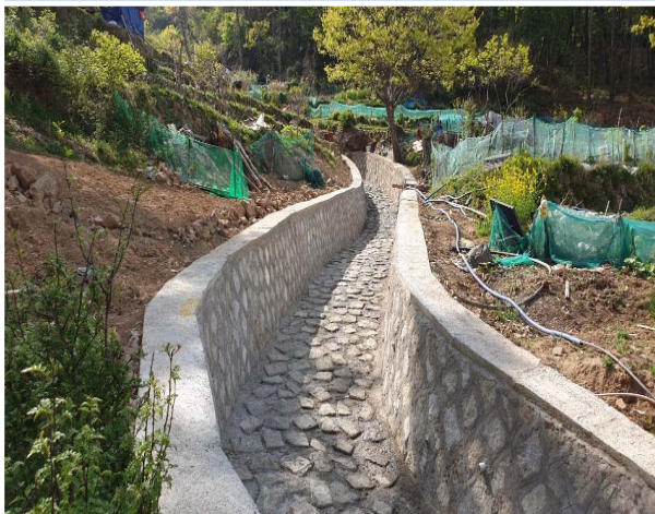
남산동 재해위험 구거정비공사 1