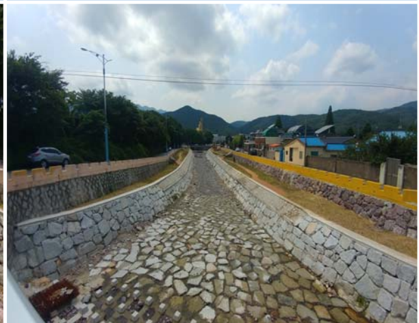
송정천 정비사업 2