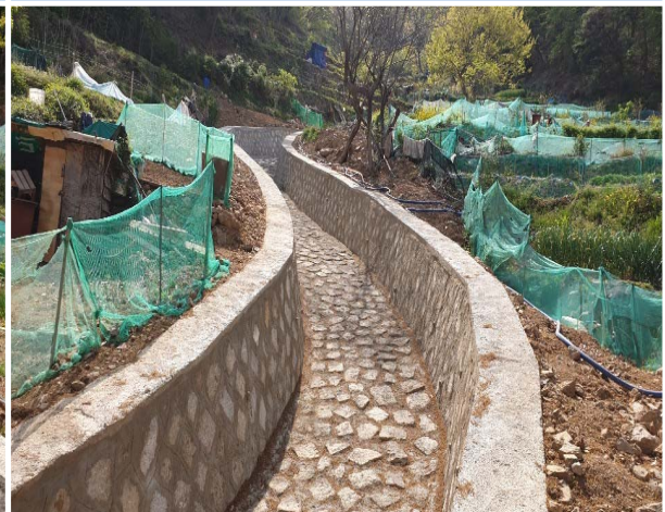
남산동 재해위험 구거정비공사 2