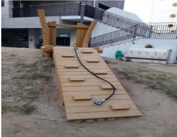
꼬마대통령 어린이집(등반형 놀이기구)