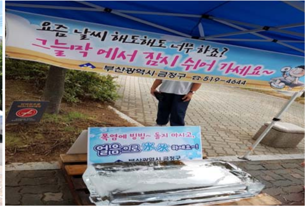
폭염 대응 활동(휴식 그늘막 설치)