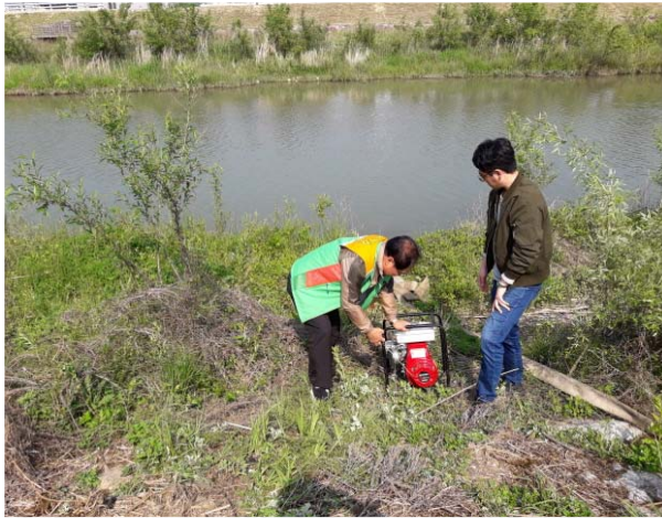
수방장비 사용법 교육(양수기)