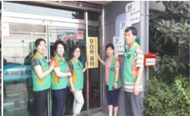
2018. 자율방재단 무더위쉼터 점검