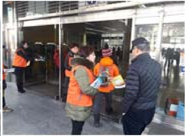
겨울철 생활안전 행동요령 리플릿 배부