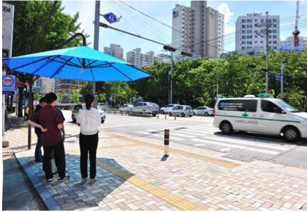
폭염 대응 활동(횡단보도 그늘막 설치)