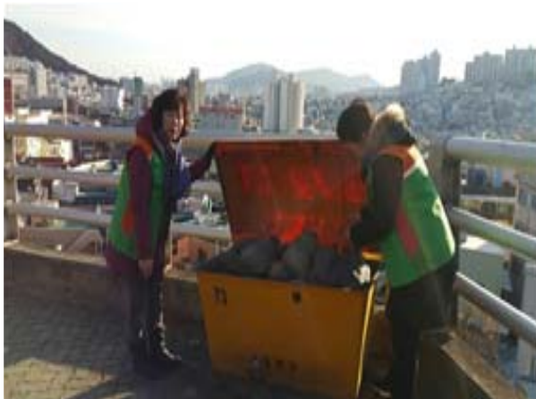
겨울철 제설함 점검