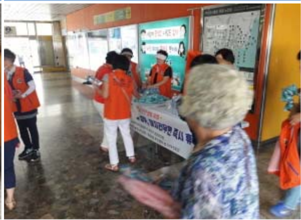
폭염대비 물품 배부