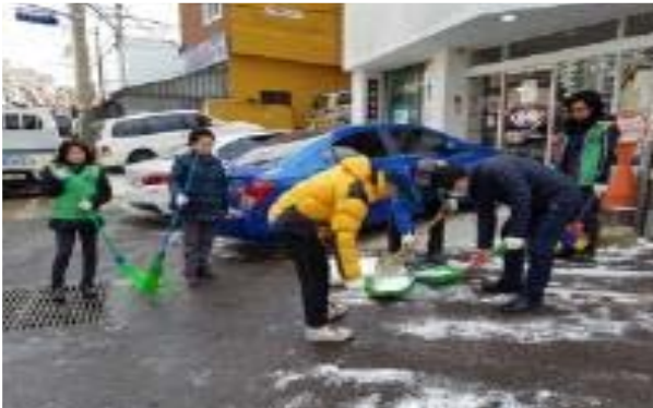
2018.01.10. 강설에 따른 제설활동

점차 대형화, 복합화 되어가는 자연재난 대처를 행정의 역량만으로는 한계가 있어 민간의 자율방재 역량을 강화하고, 재난관리를 행정과 상호보완적으로 추진하기 위한 민간조직으로서의 자율방재 체제 구축의 필요성으로 2005년 10월 12일 금정구 지역자율방재단이 구성되어 재난 예방·대비·초기대응 및 피해조기수습 등 방재분야에 적극 활동하고 있다.