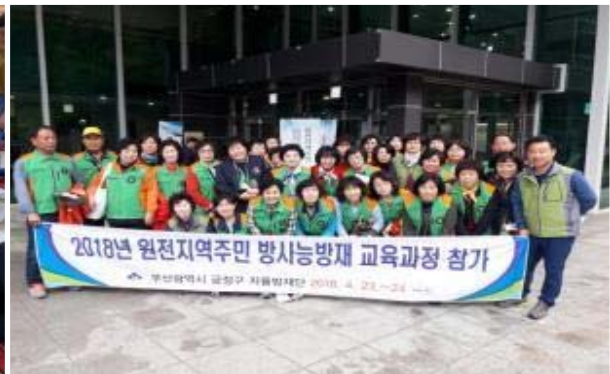
방사능 방재교육 참여

조직은 17개동 258명으로 단장 1명, 간사 1명, 동대표 17명으로 구성되어 있으며, 방재단의 활동방향 검토·조정 및 정책 건의 등을 목적으로 지역자율방재협의회를 두고 있다. 방재단의 2018년 주요 연혁은 다음과 같다.