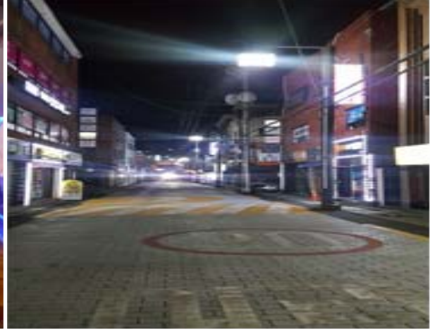
가로등 야간 순찰(127번 배전함 정비)