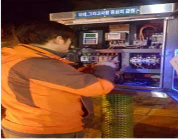
가로등 야간 순찰(281번 배전함 정비 중)

우리 구 관내 설치된 도로조명시설을 최적의 상태로 유지 관리하는 일도 매우 중요하다. 이를 위하여 주1회 이상 야간순찰 실시로 미 점등 장소 및 구간을 조기 발견하여 보수단가계약업체 및 구청 자체 가로등 보수반이 이를 신속히 보수 조치하여, 야간도로통행에 주민들의 불편함이 없도록 지속적으로 관리하고 있다.