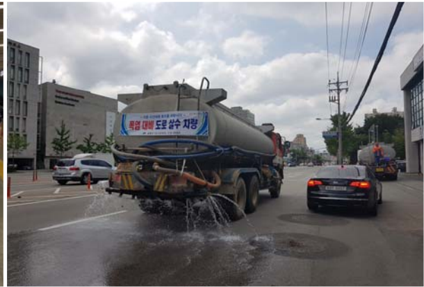
폭염 대응 활동(도로 살수)