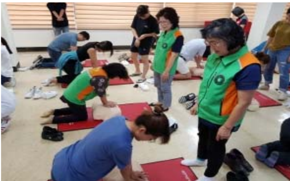
방재단 전문교육(응급처치) 참여