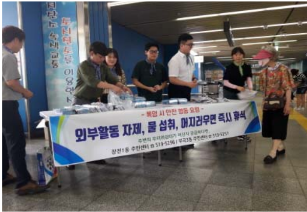
폭염 대응 캠페인