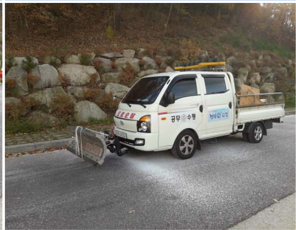
노포사승로 제설 작업