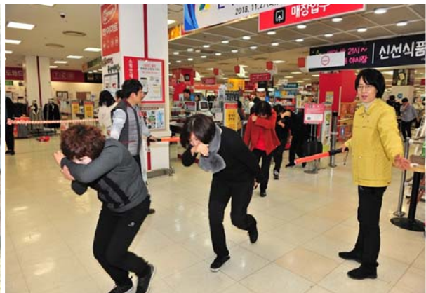
제409차 민방위의 날 화재 대피 훈련