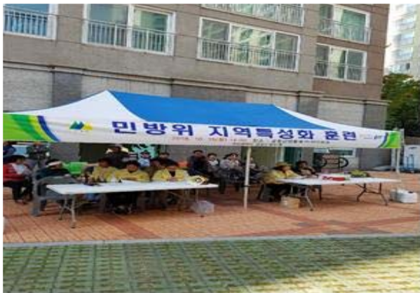
장전1동 금정산쌍용에기아파트 화재대피훈련