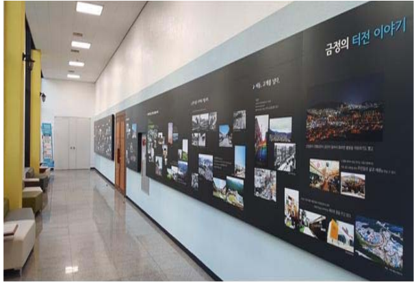
금정 30년 사진갤러리 조성(후)