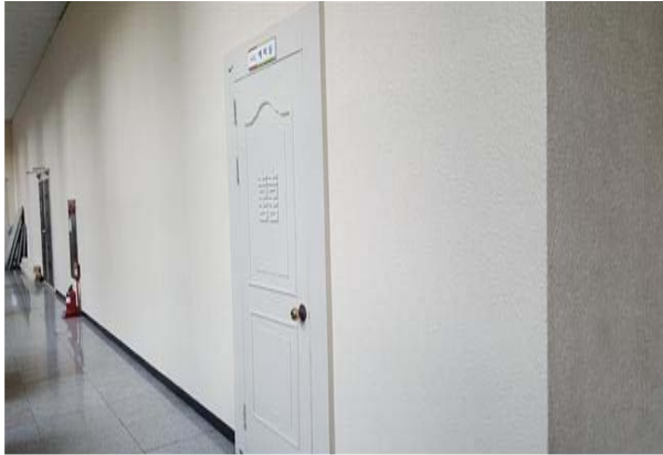
금정 30년 사진갤러리 조성(전)