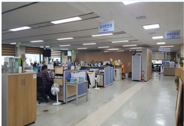
6층 개방형 사무실 조성 (후)