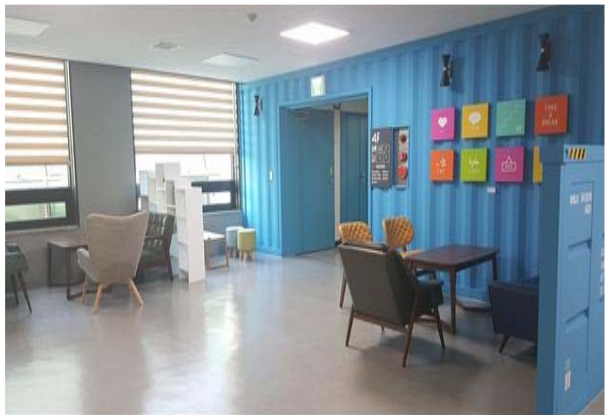
4층 직원 휴게공간 조성 (후)