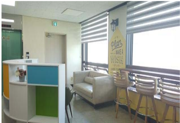
7층 직원 휴게공간 조성 (후)