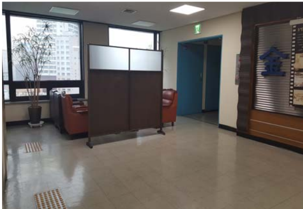
7층 직원 휴게공간 조성 (전)