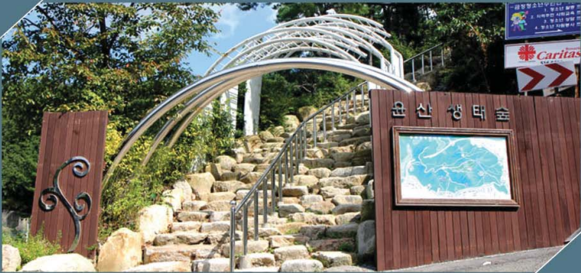
부산 금정구 윤산태생숲