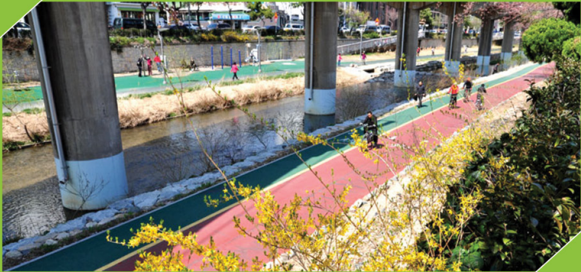
부산 금정구 온천천