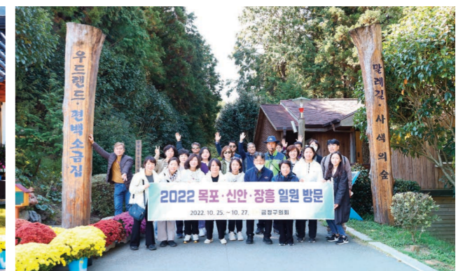
장흥군 편백숲 우드랜드