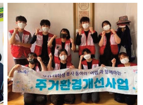
「어썸」과 함께하는 희망드림 해피하우스