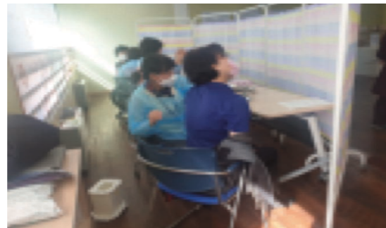
코로나19 내소 예방접종