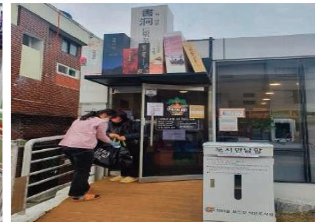
상호대차 도서 전달