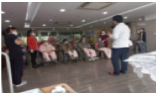
요양시설 방문 코로나19 예방접종