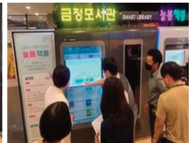
U-도서관 “늘봄책봄” 시연회