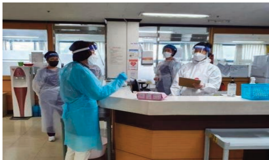
요양시설 감염병 관리 교육