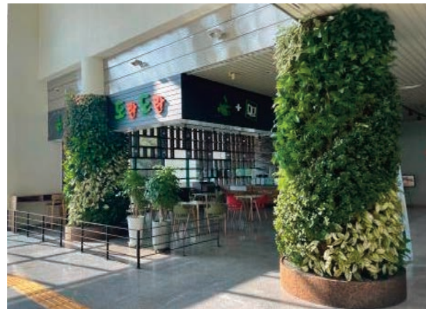
1층 로비 스마트 가든 조성