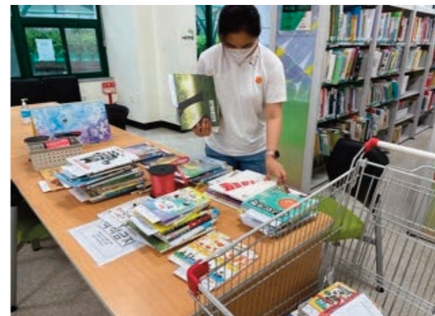
상호대차 도서 선별작업