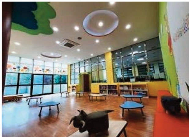
유아실 환경개선 공사