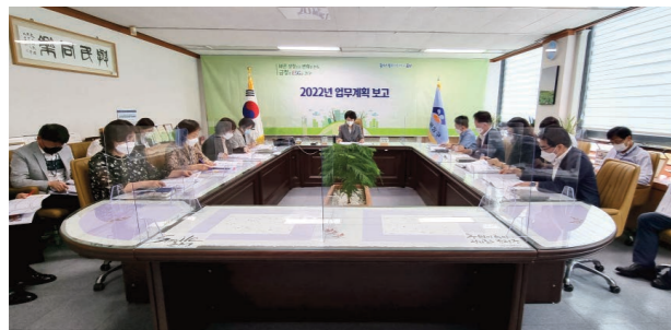
2022년 주요업무계획 보고