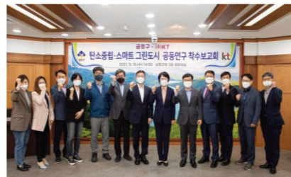
KT 협업 공동연구