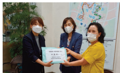
공공병원 유치 서명부 전달