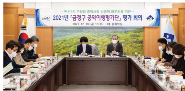
2021년 금정구 공약이행평가단 평가회의