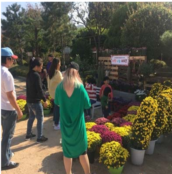
3차 게릴라 가드닝