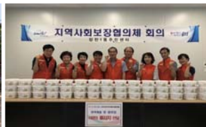
시원~한입 물김치 지원사업