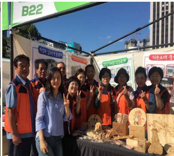
자립형 프로그램 운영(천연공예)