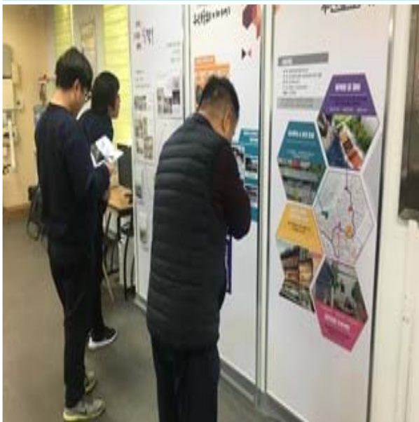
2차 그림 디자인 사진전시회