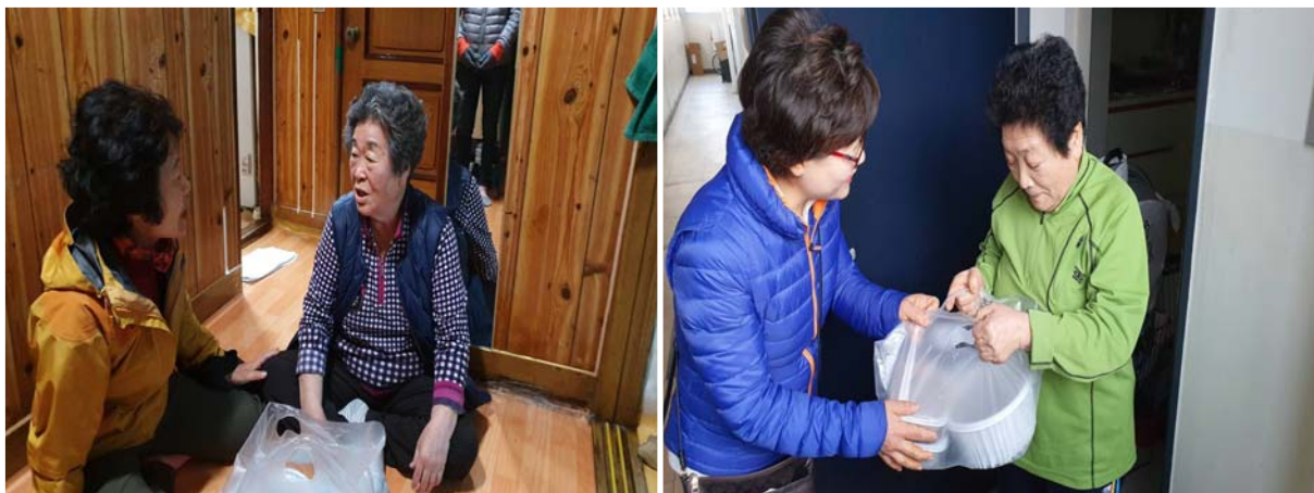
소정마을 정담은 반찬나눔 지원