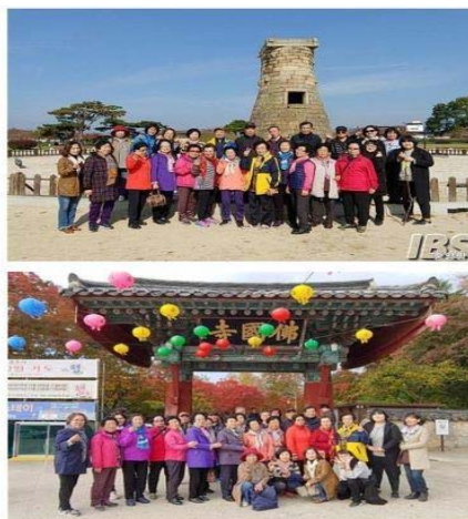
금정구 부곡4동, 홀로어르신들과 함께 경주 나들이

부산-세종지방간행물문화기부 - 문화기부금 지원(주) 부곡4동 지역사회보장협의체(위원장 조계환)는 지난 12일 관내 홀로어르신들을 모시고 경주 전통 문화재 탐방 나들이를 다녀왔다.