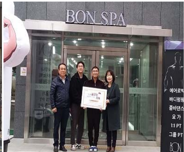
본스파 & 피트니스(10호점)