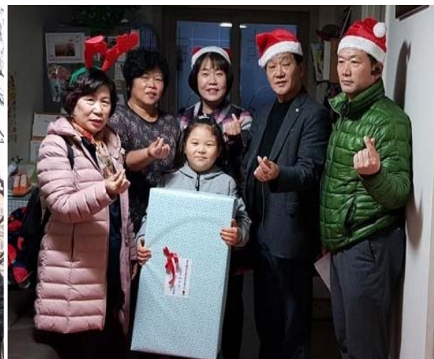
크리스마스 선물 전달