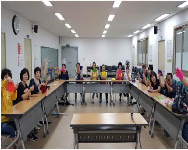
《여성장애인 자조모임 활동》