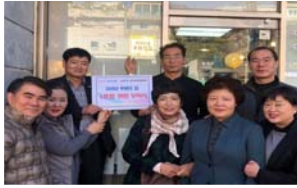
미리내 후원의 집