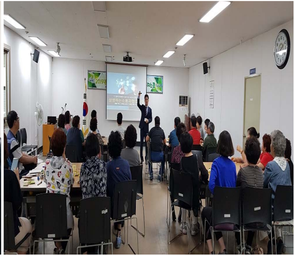
찾아가는 복지스쿨 강의