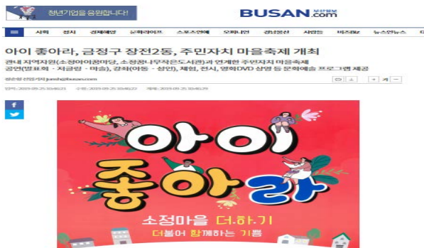
9.25. 부산일보 홍보자료