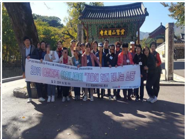
《 합동나들이 》