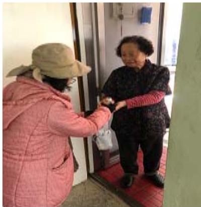
사랑의 야쿠르트 배달사업