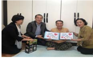
이웃愛 온기나누기 사업