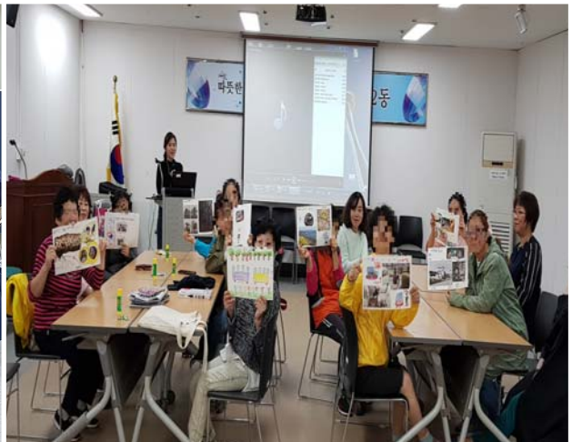
《 여성장애인·주민과의 관계증진 활동 》