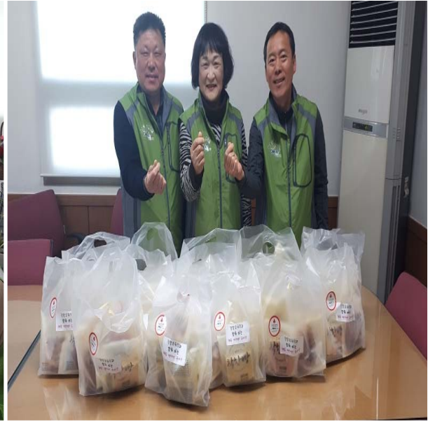
행복 뱅뱅 봉사단