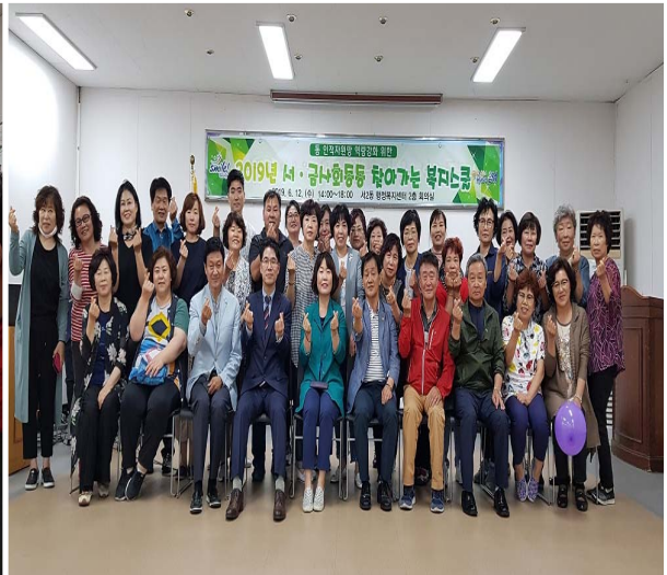
찾아가는 복지스쿨 단체사진