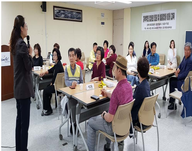
《 지역주민 참여교육 》