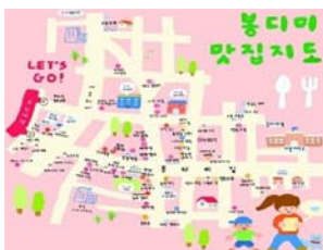
봉디미 맛집지도 제작