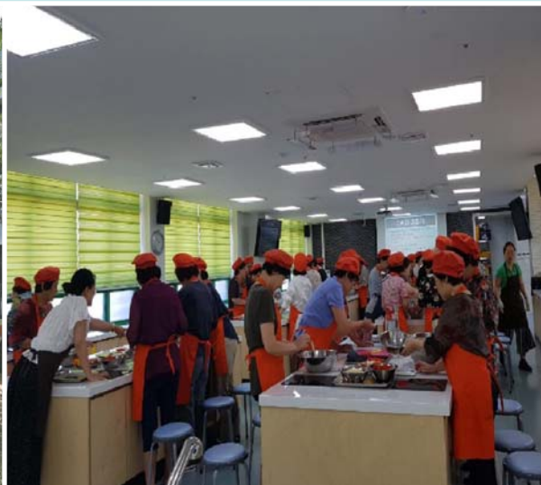
영양체험 프로그램 운영