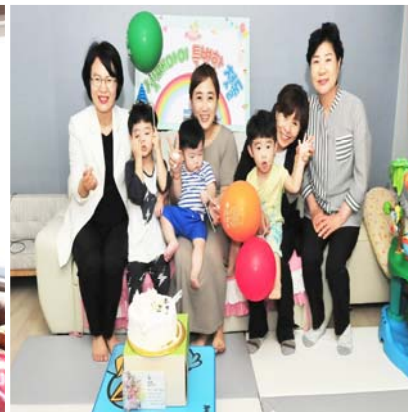
셋째 자녀 돌케이크 지원 사업