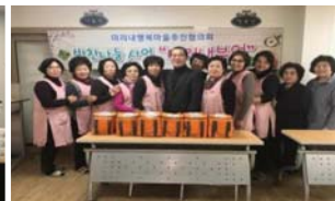
미리내 부엌 사업