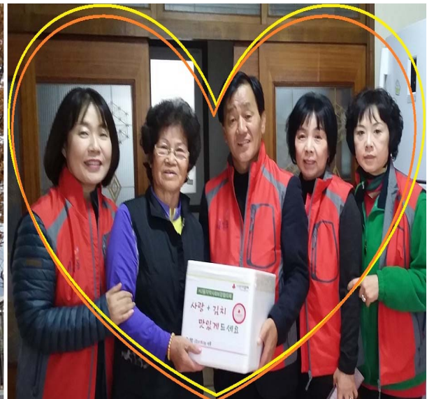
《 김장김치 전달 》