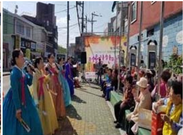
국악과 춤 한마당