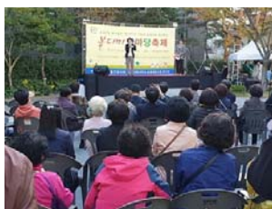
봉디미 한마당축제개최 (2019.10.30.)