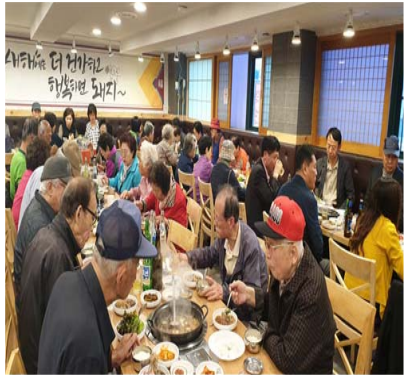
가정의달 맞이 경로잔치