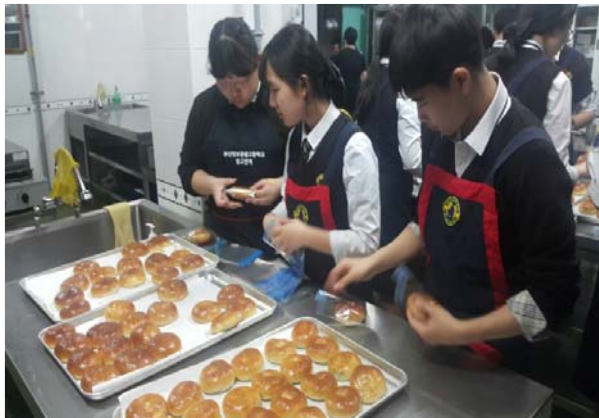
빵 굽는 사랑의 파티쉐