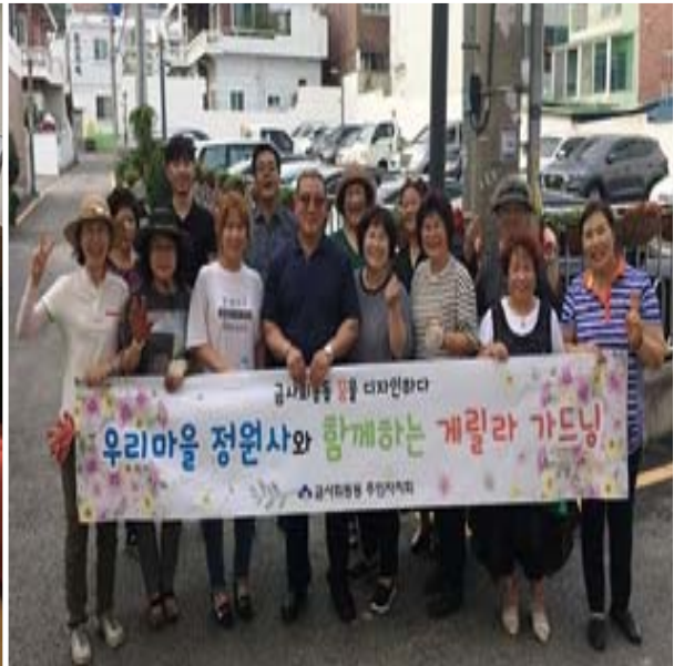
1차 게릴라 가드닝