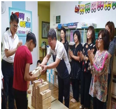
손 선봉기 전달