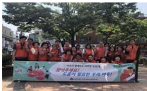
복지사각지대 발굴 캠페인