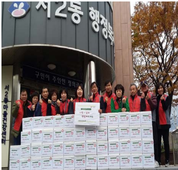
《 기탁식 》