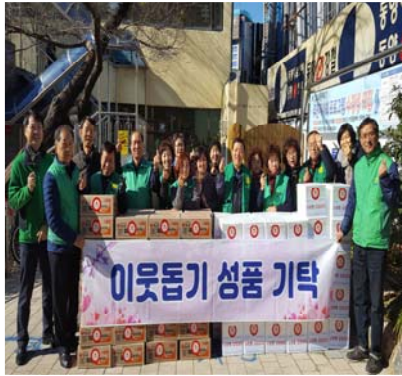
이웃돕기 성품 기탁