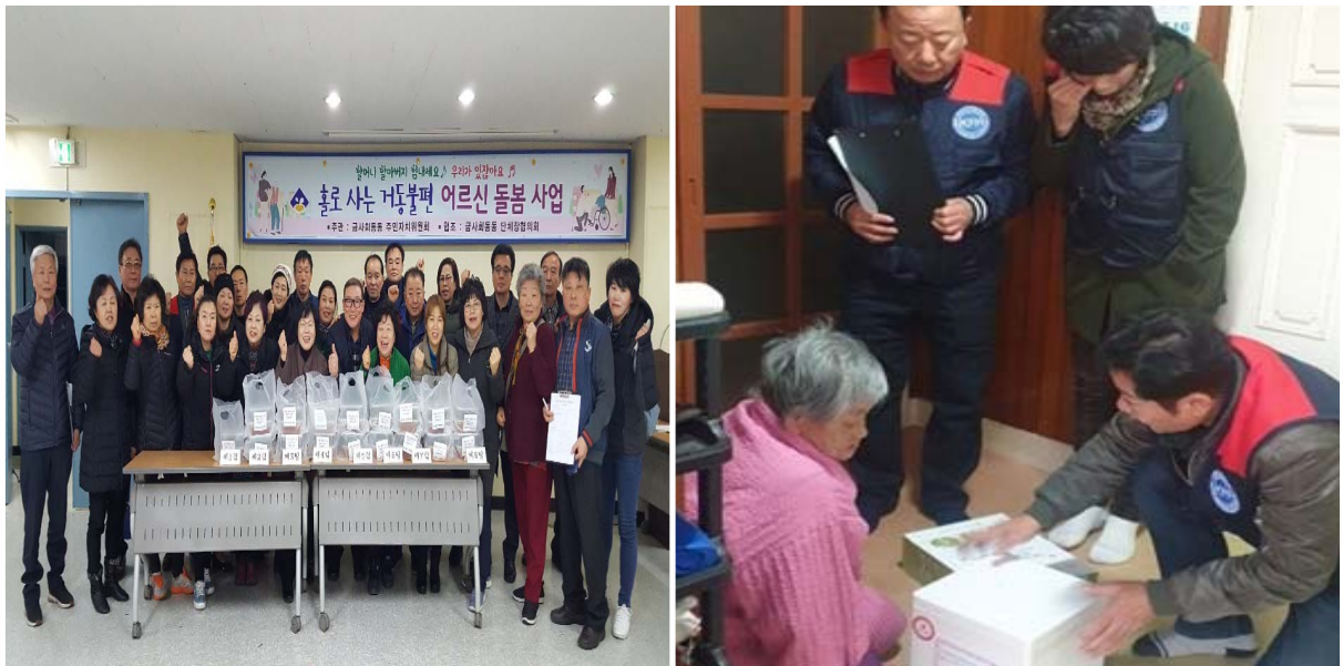
홀로 사는 거동 불편 어르신 돌봄 사업