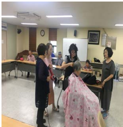
뷰티풀 화요일 예쁜 가세 머리방