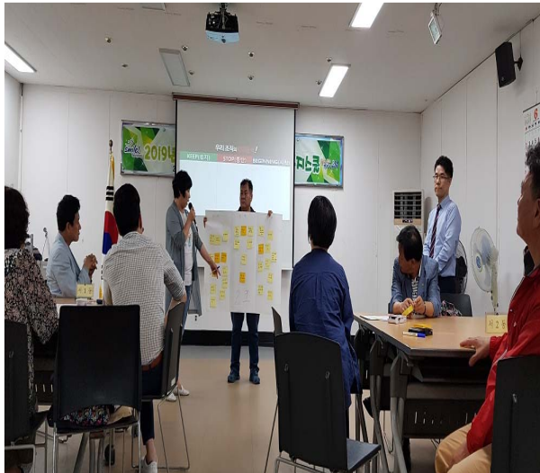
찾아가는 복지스쿨-현안문제 토의