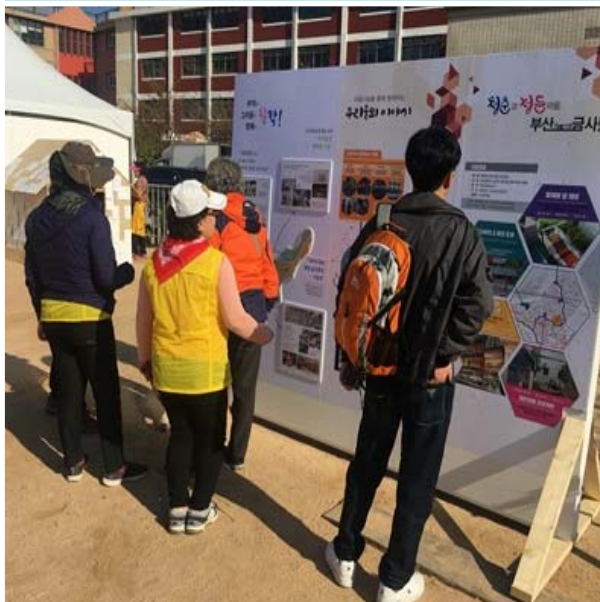
1차 그림 디자인 사진전시회