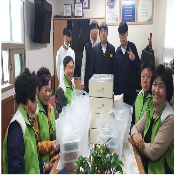
맛드림.효드림봉사단 도시락 지원사업