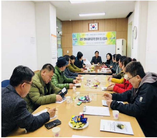
발대식 · 소양교육