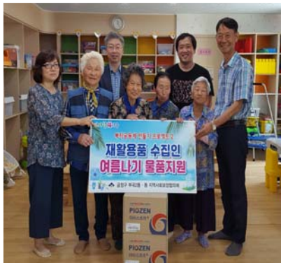
재활용품수집인 여름나기 물품지원