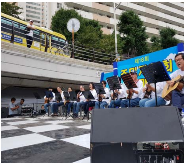
주민자치회 슞싸사랑 한마당