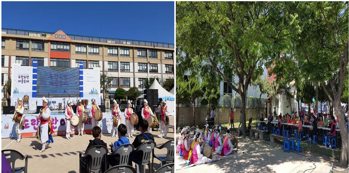
자립형 프로그램 운영(풍물)