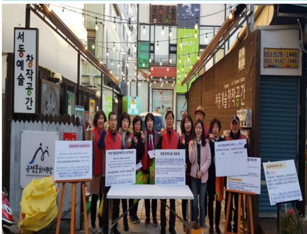
《 인권보장 및 폭력예방 캠페인 》