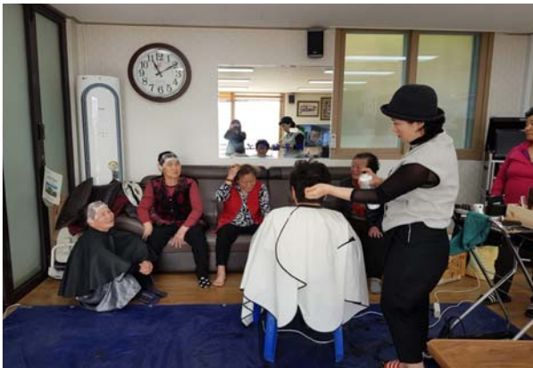
모락모락 봉사단 이·미용봉사활동