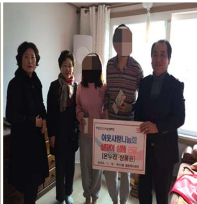
설·추석 명절 위로금 전달사업