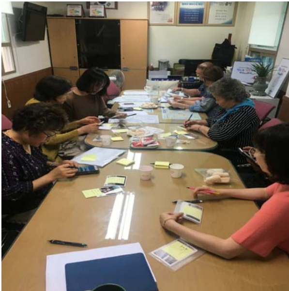
그리움 디자인 수업