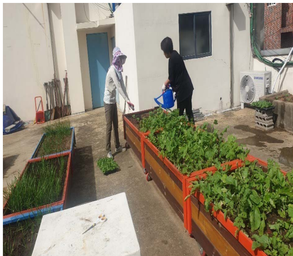
스사랑 나눔 옥상텃밭 운영