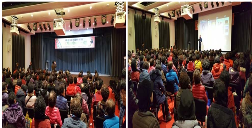
세상을 바꾸는 시네마 극장 운영