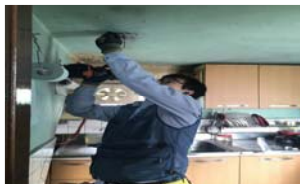
미리내 빛드림 사업