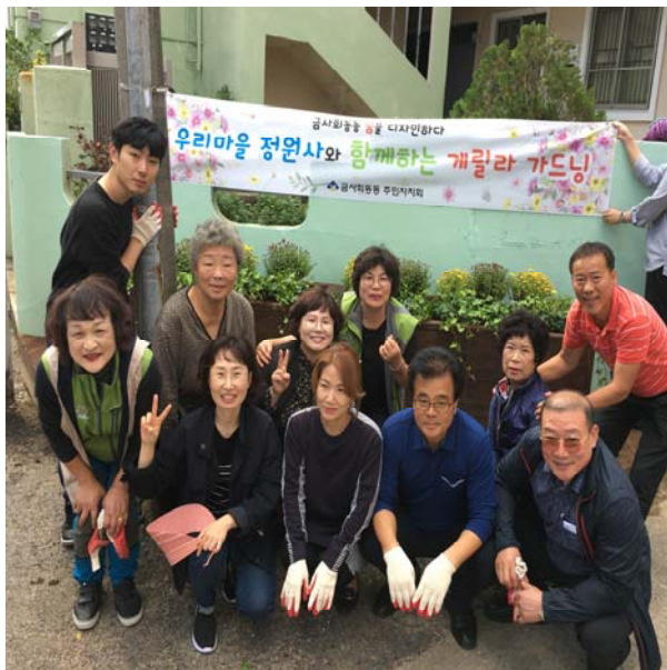
2차 게릴라 가드닝