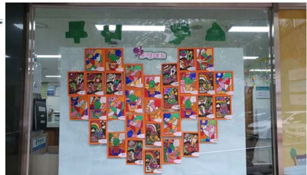
소정아이꿈마당 작품 전시